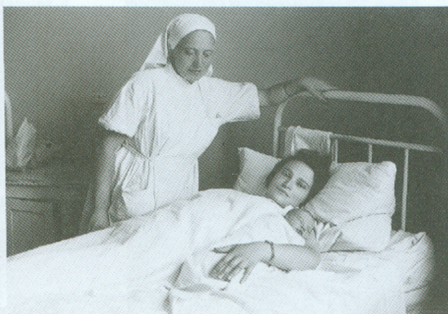
Judelio žmona Šeina su naujagime, 1937 m.