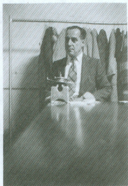
Mordechajus Pietų Afrikoje, Pietermaritzburge drabužių valykloje.

Rokiškio pašto darbuotojai, Nepriklausomybės paminklas, žmonių portretai, švenčių akimirkos. Matyt, ne visas fotografijas žymėdavo, nes ant kai kurių