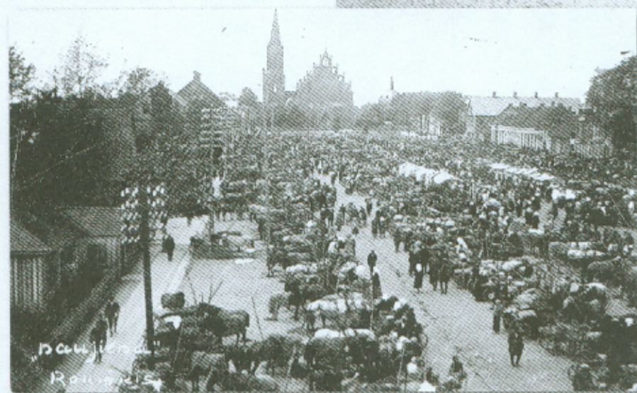
Fotoateljė „Naujiena“ daryta turgaus Viešojoje aikštėje fotografija, XX a. 3-iasis deš. RKM-2853