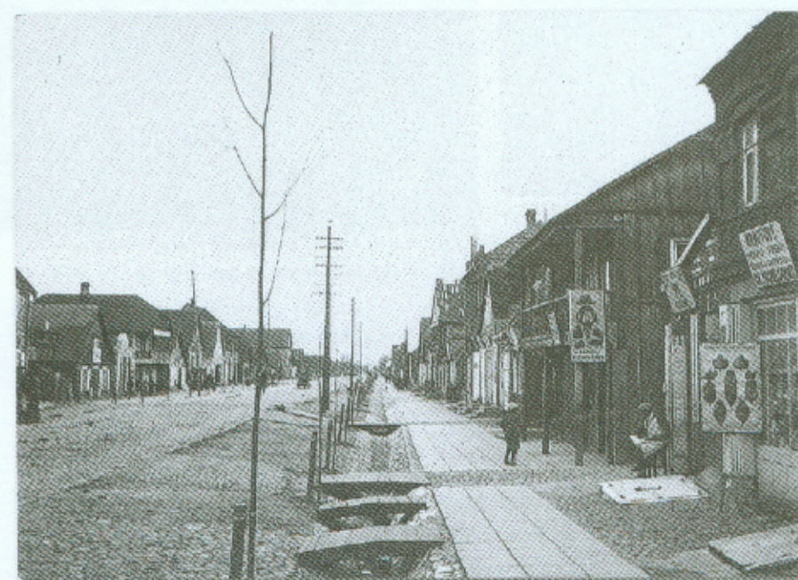
Kamajų (dabar – Respublikos) g., apie 1931–1932 m. RKM-52365/190