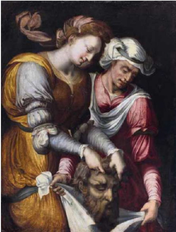
Iš Tyzenhauzų meno kolekcijos. A. del Sarto, Judita, laikanti Holoferno galvą, XVI a. pr.