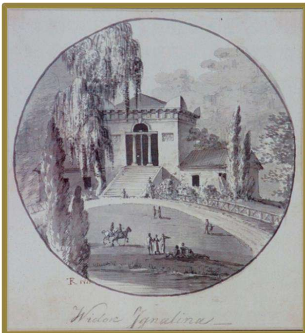
Konstantinas Tyzenhauzas. Ignatiškio dvaro vaizdas, 1813.

Grafas Konstantinas Tyzenhauzas buvo garbingos elgsenos ir gyvenimo principų besilaikęs didikas.