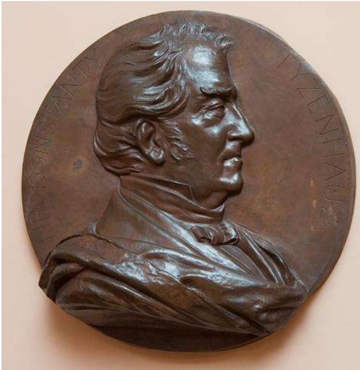
Grafo Konstantino Tyzenhauzo (1786–1853) bareljefas. Dailininkas Eugene Antoine Aizelin.