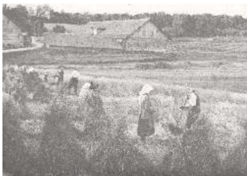
Rokiškio dvaro kiniai pastatai. XX a. pradž.