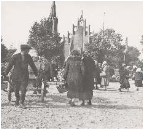
Rokiškio aikštė XX a. 4 deš.