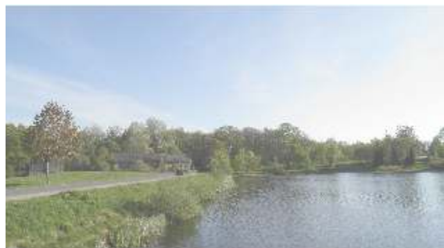
Šioje vietoje dabar tvenkinys