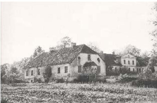
Ilzenbergo dvaro pastatai 1957 m.