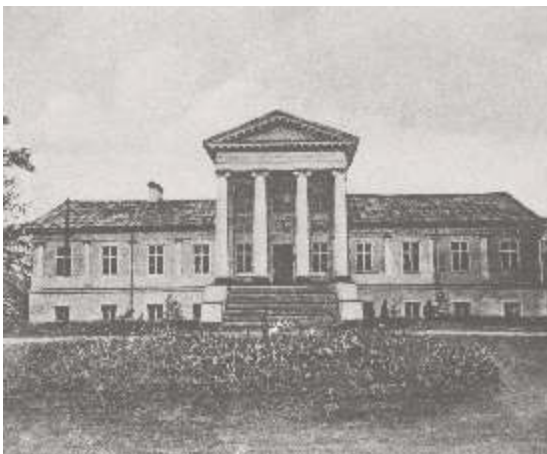
Onuškio dvaro rėmė mai XX a. pradžioje.