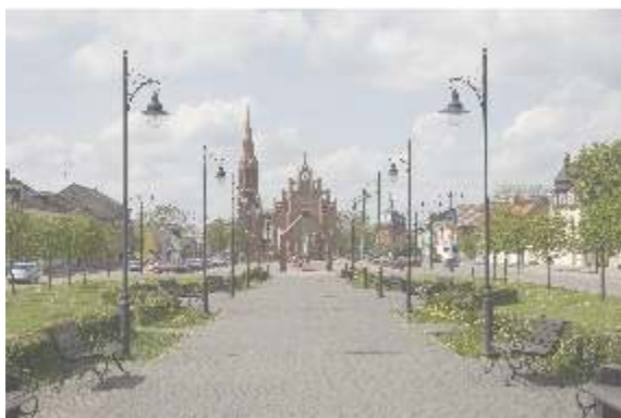
Rokiškio aikštė 2010 m.