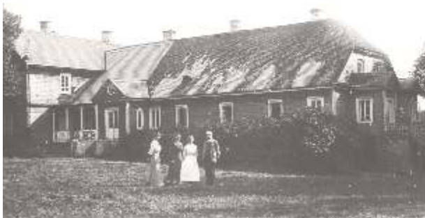
Bagdoniškio dvaras prieš II pasaulinį karą.