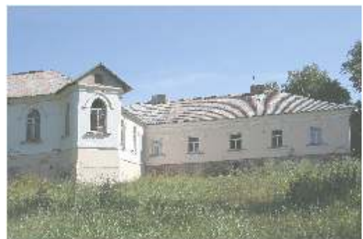
Antanaš s dvaro r. mai (fragmentas) 2006 m.