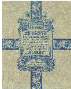
Angliški biskviti, gaminti Kavališkyje, pakuoti