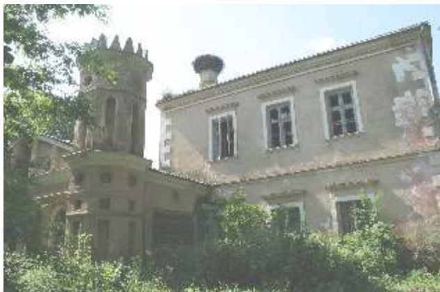
Panemunio dvaro r mai 2010 m.