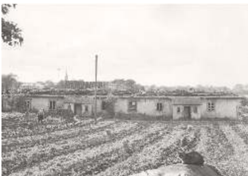
Rokiškio dvaro kumetynai XX a. 7 deš.