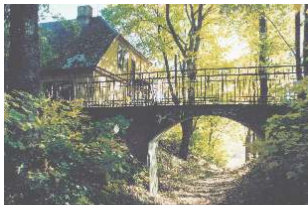
Bagdoniškio dvaras 2009 m.