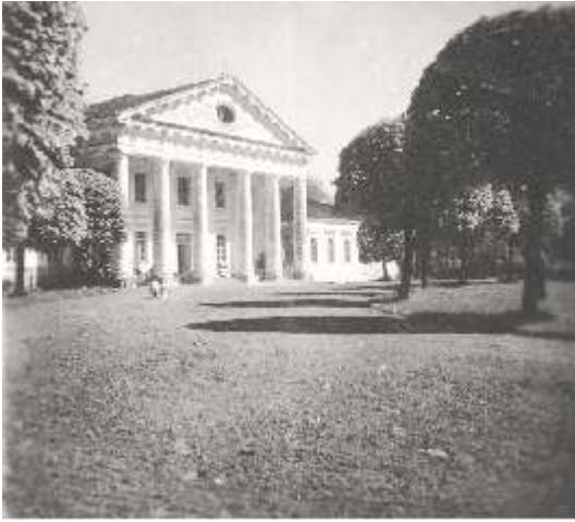
Sal dvaras r. mai XX a. pradžioje.