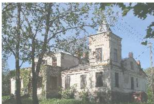
Kraščių dvaras 2006 m.