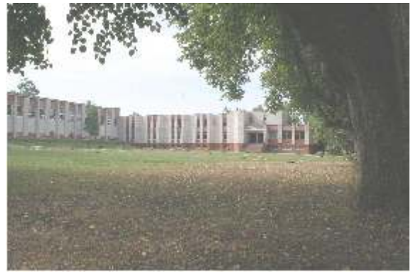
Kavoliškio dvarviet . 2006 m.