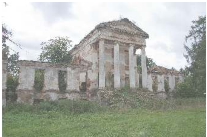
Onuškio dvaro rėmė mai 2009 m.