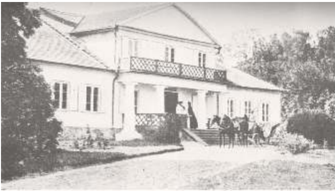
Kavoliškio dvaras 1914 m.