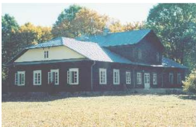
Gaionių dvaro rūmai 2002 m.

Gaionių buvusio dvaro sodybos saugoma teritorija 14 ha. Šis dvaras apie 300 metų valdė baronai Rosenai. Dvi paskutinės baronų kartos gyveno mediniame 1870 m. statytame name. Tai buvo neoklasicizmo stiliaus laisvos interpretacijos statinys. 1894 m. dvaras buvo perstatytas. Dvaras grąžintas savininkams Rosenams. Šiuo metu jis restauruotas, prižiūrimas.