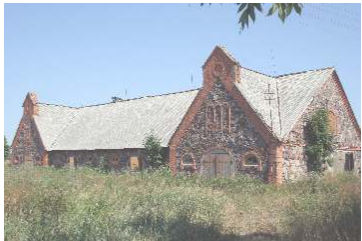
edas dvaro sodybos kiti pastatai. 2006 m.