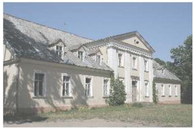
Ilzenbergo dvaras 2006 m.