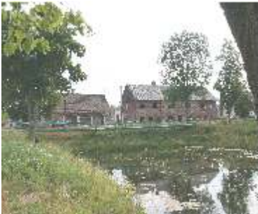
Saldaini ir konditerijos fabriko pastatai. 2006 m.