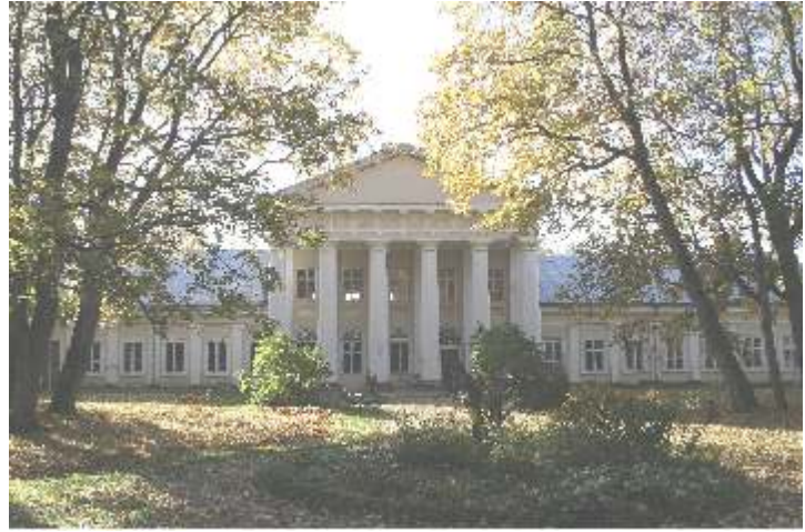
Sal dvaras r. mai 2008 m.

Petriošiškio dvaro teritorijai priklauso 2,5 ha žemės, dar yra ir žemės, kurios paskirties žemės Šiuo dvaru r. pinamasi, jis tvarkomas pavyzdinai.