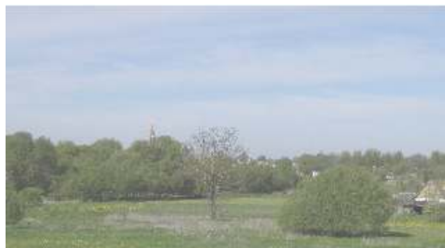
Taip ši vieta atrodo 2012 m.